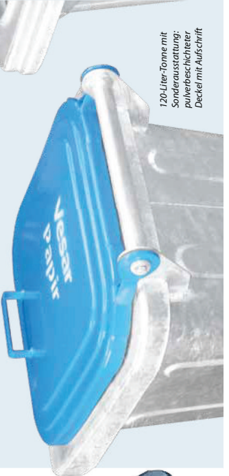
120-Liter-Tonne mit Sonderausstattung: pulverbeschichteter Deckel mit Aufschrift

Stahl werden nur hochwertige Bleche verwendet. Alle Behälter werden ausschließlich mit galvanisch verzinkten Stahlfachsen aus Vollmaterial ausgestattet. Der Behälter ist mit einem lauffähigen Vollgummireifen bestückt, welcher einer Zertifizierung gemäß DIN EN 840 unterliegt. Die Radbefestigung erfolgt durch einen federbelasteten Stahlstift, der in eine Nut an der Achse einrastet. Durch die am Behälter angebrachte Verriegelungsleiste ist eine sichere Aufnahme des Behälters gegeben und eine gängige Schüttung zur Entleerung möglich.