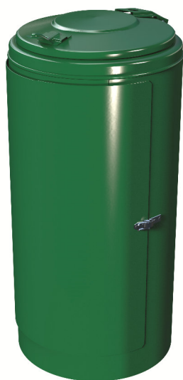
Abb. zum Aufschrauben zu