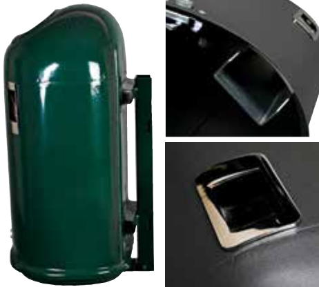
Abb.: 7035-10 in RAL 6005