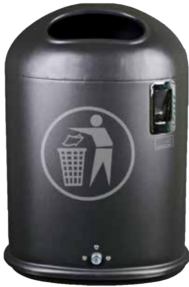
Abb.: 7035-10 in RAL 7016 mit Aufkleber 8310-00 (optional)